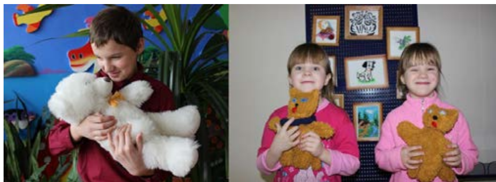
Рисунок 1. Дети с игрушками, изображающими животных, в учебно-реабилитационном центре «Горлица», г. Днепропетровск

животными, которых показывают ему его родители, по игрушкам, изображающим животных, иллюстрациям в книгах и изображениям в средствах информации (рис. 1). У него может быть собственный опыт по уходу за животными, а также негативный опыт нападений животных, укусов и других травм, нанесенных животным. Знакомство с животными продолжается в учебных заведениях (рис.2).