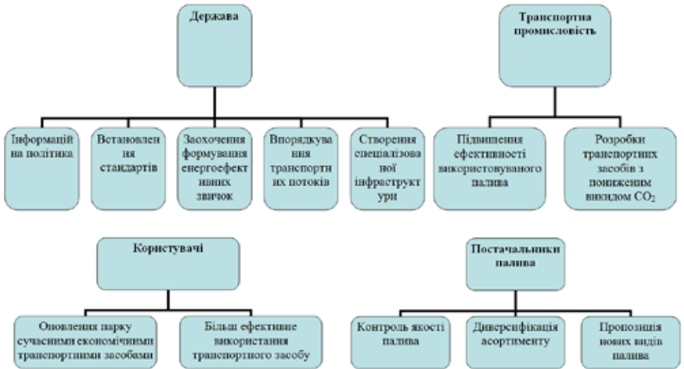
Рис. Напрями підвищення енергетичної безпеки та зниження викидів в атмосферу від транспорту

менше зниження, ніж заходи, спрямовані на підвищення ефективності спалювання палива [2].