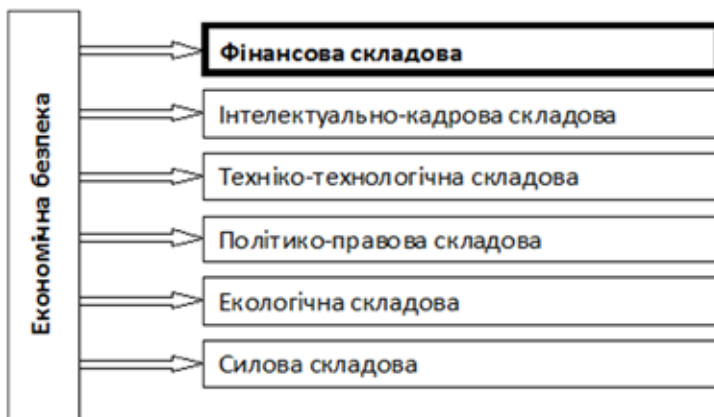
Рис. 1 Складові економічної безпеки підприємства.

Для більш глибокого дослідження економічної безпеки підприємства необхідно визначити її складові елементи (рис. 1).