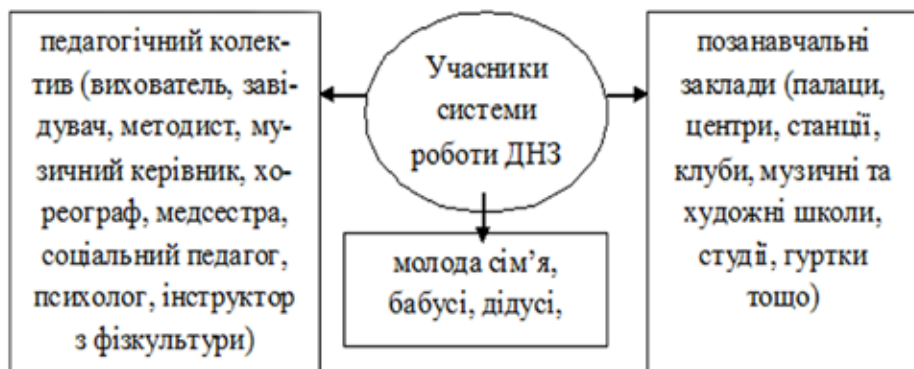
Схема 1. Учасники системи роботи ДНЗ

Слід зазначити, що у системі роботи дошкільного навчального закладу з формування культури батьківства з молодими сім'ями приймають участь багато суб'єктів педагогічного процесу (див. схема 1).