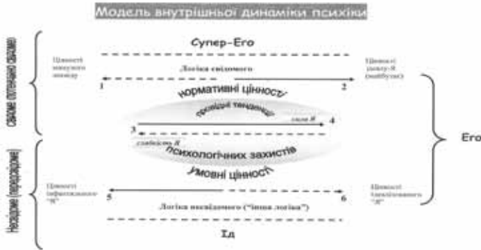
Рис. 2. Модель внутрішньої динаміки психіки

Модель (скорочена назва рис. 2) ілюструє цілісний погляд на внутрішню динаміку психічного, в його суперечливій сутності та єдності свідомого та несвідомого. Модель переконує, що підструктури, відкриті З. Фрейдом (Супер-Его, Его, Ід) знаходяться у антагоністичному протистоянні, що презентує лише один з ракурсів суперечливої сутності психічного, а саме – «по вертикалі». «Горизонталь» же характеризується співіснуванням суперечностей відповідно до законів антиномії, що передбачає взаємоподовження і взаємопідміну однієї суперечливої тенденції іншою.