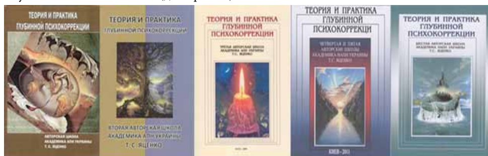
Фото 2. Книги по Авторським школам

Проведення глибинного пізнання у великій аудиторії слухачів (з екранізацією процесу) доводить можливість об'єктивування психічного в його цілісності без ущемлення Я суб'єкта. Останньому сприяє перекодування змісту психічного в матеріалізовані форми (малюнок, ліпка і т. п.). З кожної Авторської школи видаються посібники (на підставі аудіо-і відеозаписів аналітичного процесу) [8; 12; 13; 14; 15]. На даний момент проведено вісім Авторських шкіл, і на основі їх результатів опубліковано 5 посібників (див. фото 2).