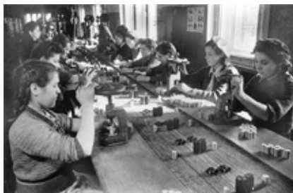
Изготовление взрывателей для минометных снарядов.

С незапамятных времён человечество стремилось летать. Наверное, это было их самое желанное мечтание. Со становлением современной цивилизации, людям