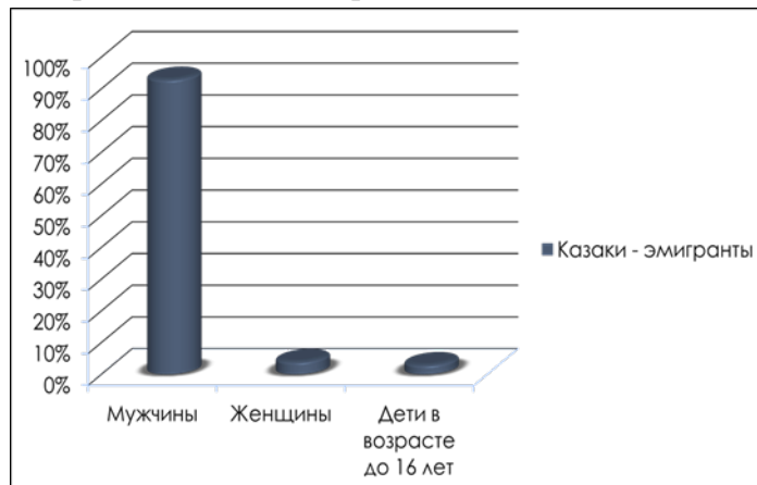
Диаграмма 1. Казаки-эмигранты

55 % казаков эмигрантов были в возрасте от 20 до 30 лет и 25 % – от 30 до 40 лет. Если при этом учесть, что во время репатриации 1921-1924 гг. на родину возвращались в основном старики и казаки, чьи семьи остались в России, то процент мужчин в возрасте от 20 до 30 лет окажется еще более высоким.