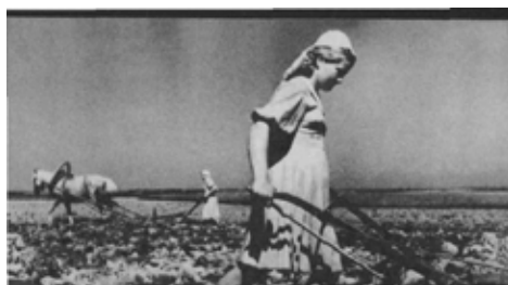
Вспашка огородов во время войны.