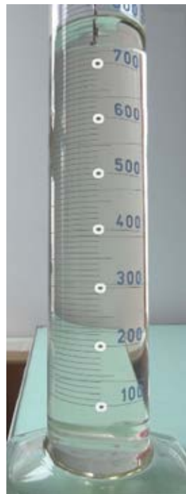
Рис. 2. Стробоскопічна версія. На одному фото зведені кадри: К-7, К-33, К-59, К-87, К-115, К-143, К-171.

Деякі занижені значення інтервалів часу \Delta t між зафіксованими кадрами (табл.2) можна пояснити великим кутом зору знімальної камери на позначки