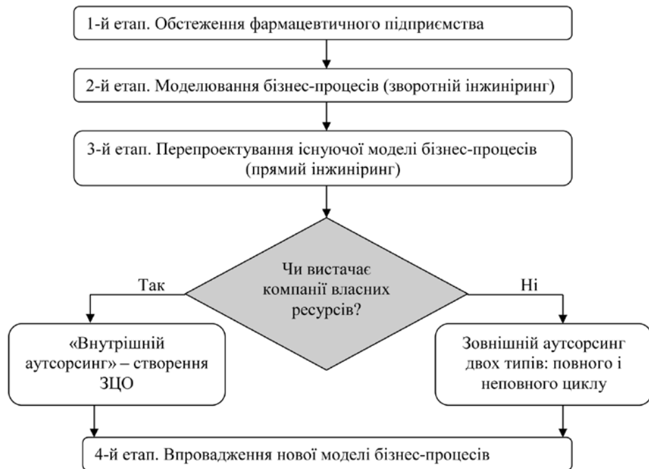
Рисунок 1 – Алгоритм реінжинірингу бізнес-процесів на фармацевтичному підприємстві того, щоб встановити, чи відповідає реальний бізнес-процес своїй моделі.

На другому етапі процесу реінжинірингу відбувається моделювання бізнес-процесів, які існують на підприємстві, проводиться перевірка адекватності існуючих моделей бізнес-процесів; аналіз виявлених проблем бізнес-процесів; розробка рекомендацій (пропозицій) з оптимізації існуючих бізнес-процесів.