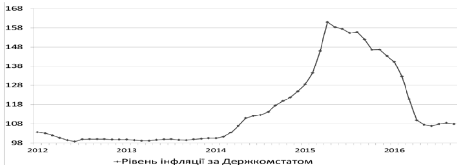
Рис. 1. Рівень інфляції в Україні за 2012-2016рр..

Катастрофічне зростання рівня інфляції (рис 1), збільшення внутрішнього і зовнішнього державного боргу, нестабільність валютного курсу, постійне зростання грошової маси, заборгованості держави з виплат заробітних плат населенню, постійне накопичення неплатежів, низька купівельна спроможність українців, нестабільність на сході країни. Складність полягає у тому, що частина населення вихована на радянських принципах, почала звикати до такого ганебного існування і не може слугувати складовою синергії.