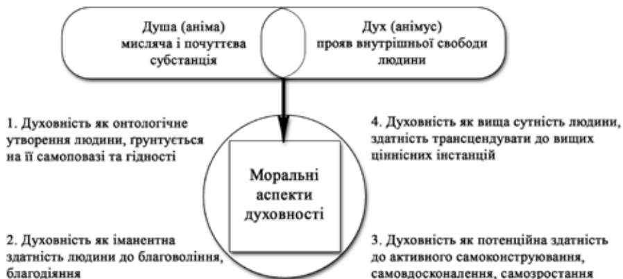
Рис. Моральні аспекти духовності за І. Кантом

предметно-перетворювальною активністю людини, а належних до сфери абсолютно-го духу. У цій ситуації не було необхідності в якомусь особливому визначенні духовності: зміст поняття впливав із ситуації розрізнення об'єктивного і суб'єктивного духу і їх взаємодії. В цьому ракурсі, погляди Канта стосовно моральних аспектів людської духовності можна зобразити з допомогою мислешхеми (рисунок).